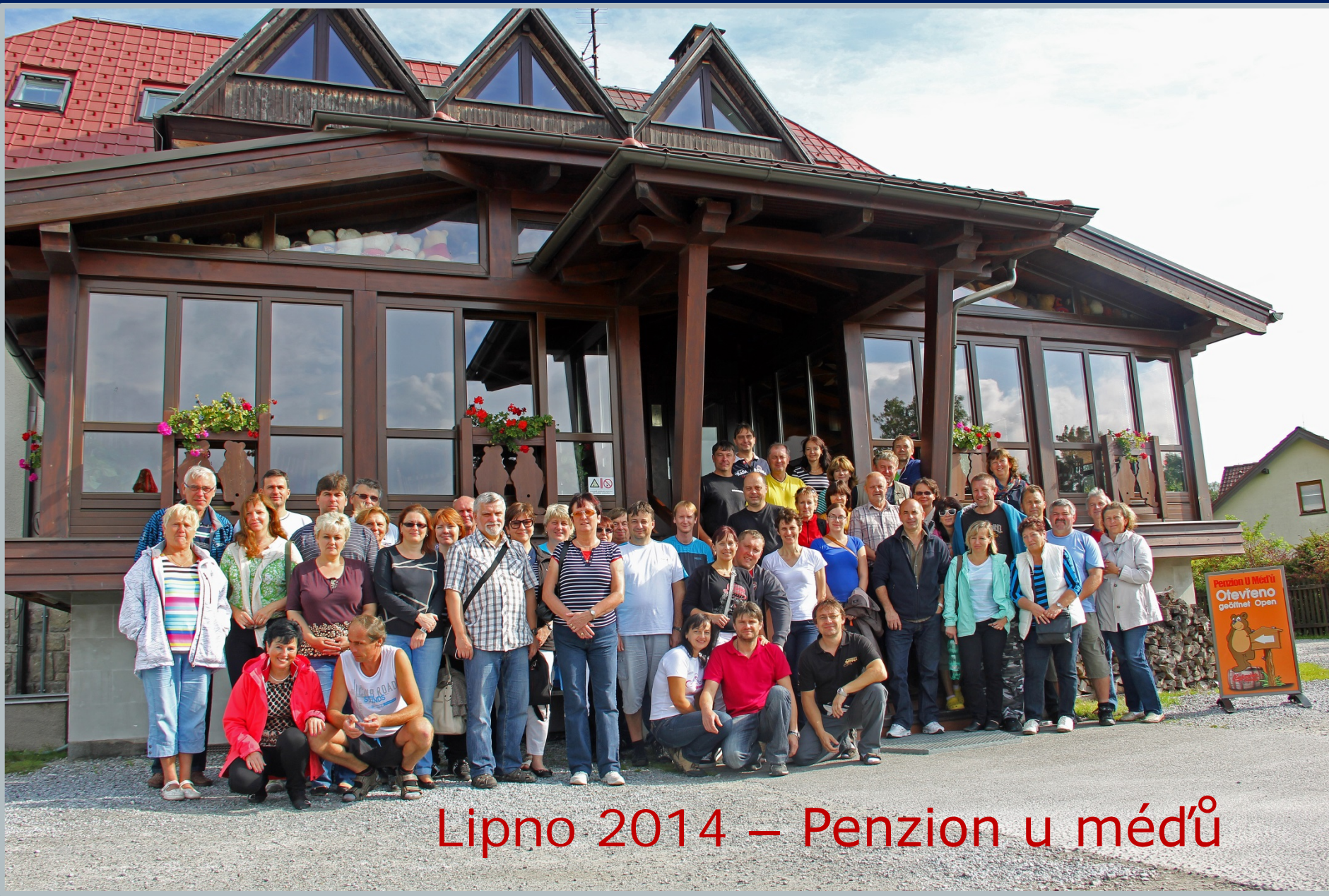
Lipno 2014 – Penzion u méďů